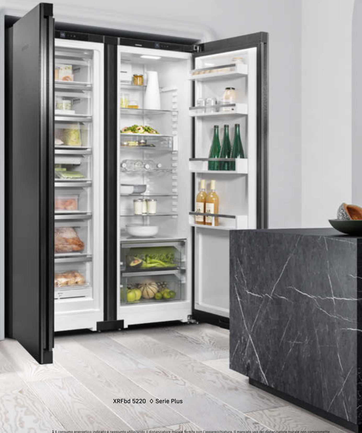
XRFbd 5220 ◊ Serie Plus